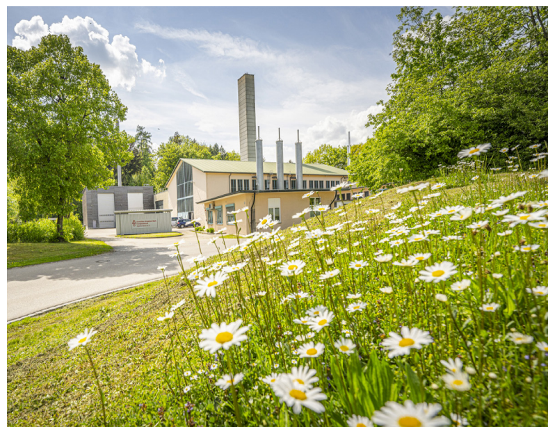
Das Energiezentrum des DRW in Ursberg. Hier werden täglich bis zu 4.000 Menschen mit Strom und Wärme versorgt.

Um seine Stillstandzeit dabei so kurz wie möglich zu halten, wählte das DRW einen Jenbacher reUp Longblock Motor aus dem Remanufacturing Austauschprogramm. Dieser steht schon bereit, noch bevor der bestehende Motor ausgebaut wird. Und damit der Austauschmotor schnell in Betrieb gehen kann, wird er schon im Jenbacher Werk im Detail so konfiguriert, wie es mit dem Kunden vorab vereinbart wurde.